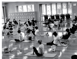
27 西健康づくりセンター ゆるゆる健康体操