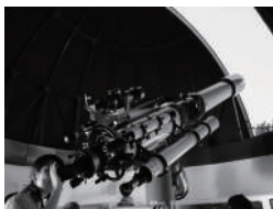
19 札幌市青少年科学館 天文台夜間公開