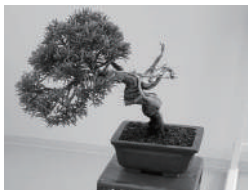
25 豊平公園 秋の盆栽管理講習会