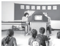
35 西岡図書館 たのしいおはなしの会