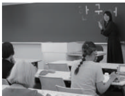
10 北星学園大学 ハンゲル入門講座