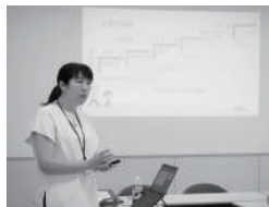
16 星槎道都大学 公開講座