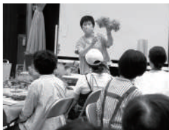
26 百合が原公園 講習会