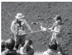
20 豊平川さけ科学館 琴似発寒川サケ観察会