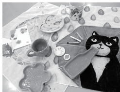
23 札幌芸術の森 ふらっとクラフト体験