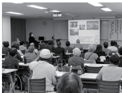
11 北海道医療大学 公開講座