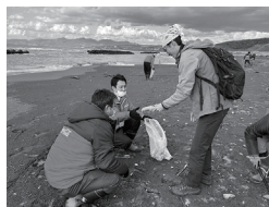
21 北海道博物館 "海岸漂着物"への取り組み