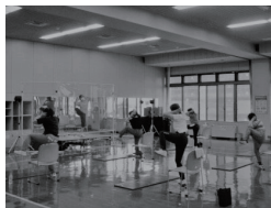
28 東健康づくりセンター 初めての筋活教室