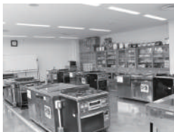
29 北区民センター グルテンフリーパン講座