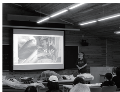
18 学校法人酪農学園 野生動物獣医学が目指すもの