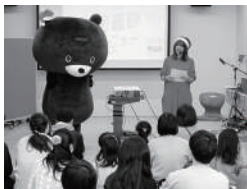
33 えほん図書館 図書館デビュー